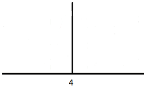
valore senza incertezza

Nel caso di un risultato di 4 con un'incertezza di \pm 1 :