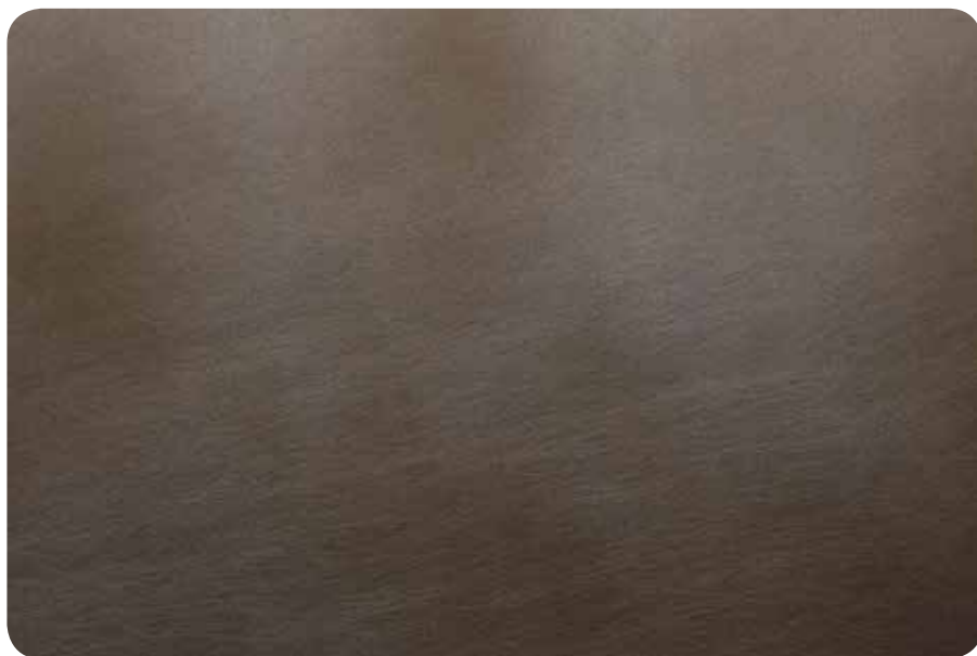
СВИНЕЦ С ЭФФЕКТОМ СТАРЕНИЯ