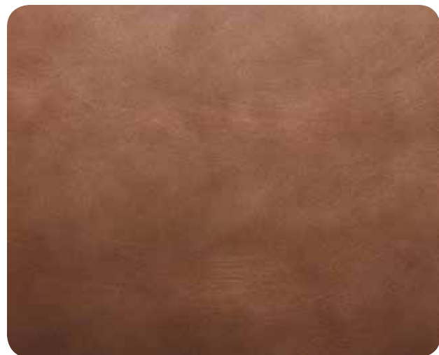
МЕДЬ С ЭФФЕКТОМ СТАРЕНИЯ