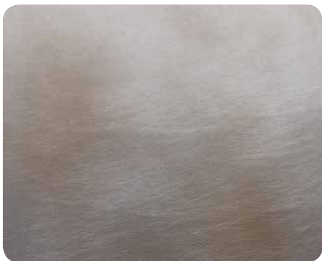
СТАЛЬ С ЭФФЕКТОМ СТАРЕНИЯ