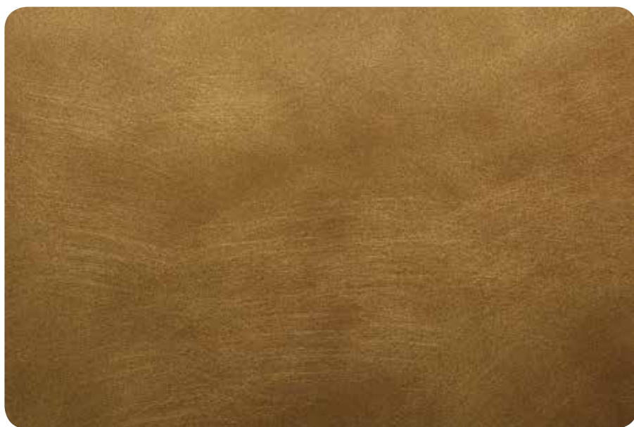
ЗОЛОТО С ЭФФЕКТОМ СТАРЕНИЯ