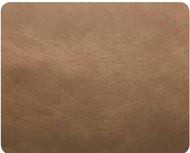
БРОНЗА С ЭФФЕКТОМ СТАРЕНИЯ